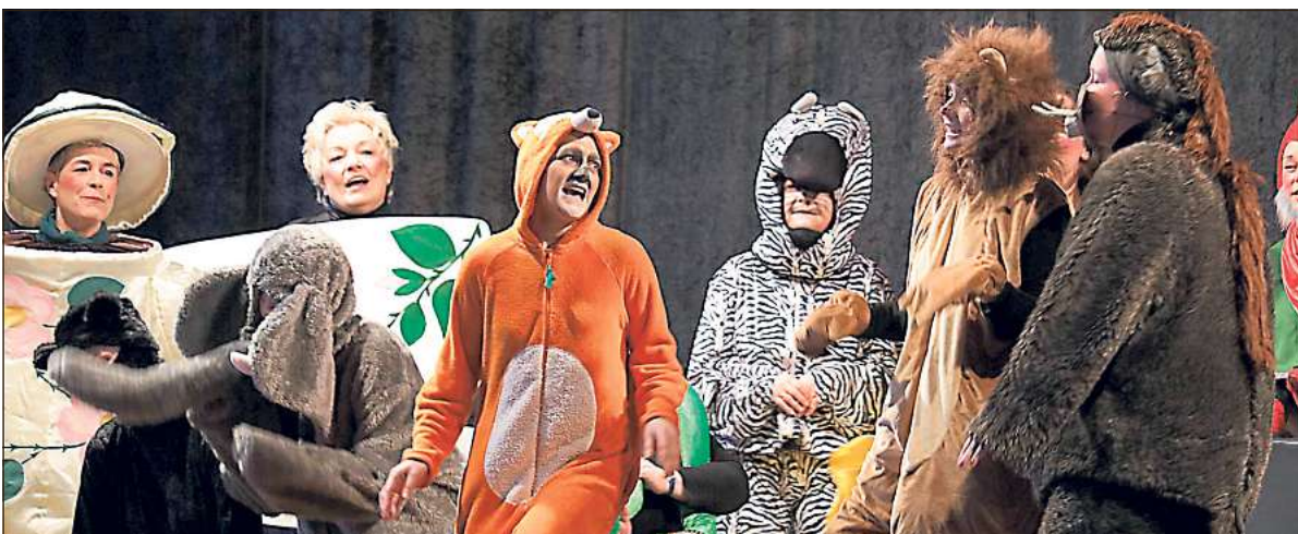
Dschungelbuch und Co.: „Disneys Musicals“ brachten die jecken Langenbergerinnen gleich zu Beginn des dreistündigen Programms auf die Bühne. „Karneval, Firlelanz, Disneyland“ war die Sause überschrieben.

schönen Neubauten Platz machen können. Auch, dass der Bürgerbrunch eine Wiederholung finden soll, hatte bis dato niemand erwartet. Gefrühstückt werden soll aber nicht auf der Hauptstraße, sondern am Nabel von Langenberg, dem Merschweg, verriet der Coiffeur im Gespräch mit seinen Kundinnen.