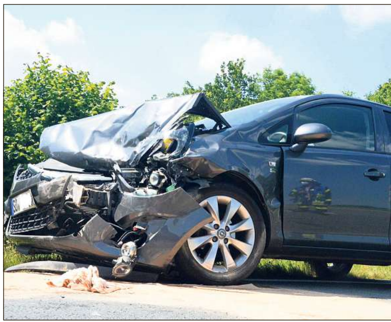
Abgeschleppt werden musste dieser Opel. Sein Fahrer hatte das Bremsmanöver des vor ihm befindlichen Suzuki nicht rechtzeitig erkannt, so dass es zur Kollision kam. Das Unglück ereignete sich am Samstagnachmittag auf der B 55 bei Langenberg.