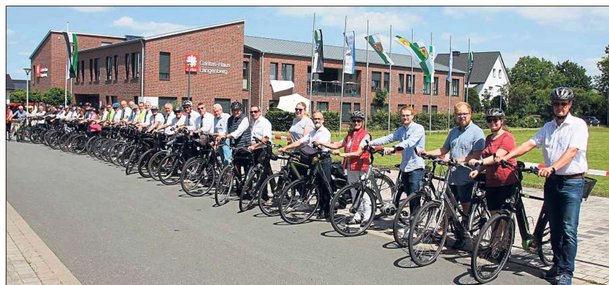
Am Haus der Caritas fiel der Startschuss für eine gemeinsame Radtour im Rahmen der Aktion „Schützen on Tour“. Rund 80 Teilnehmer machten sich dazu am Samstag gemeinsam auf den Weg.

Weitere Fotos im Internet: www.die-glocke.de